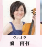
ヴィオラ 前 南有